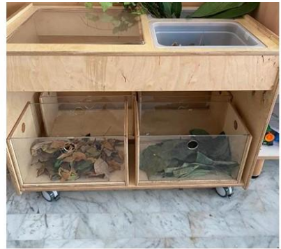
Scuola dell'Infanzia Armando Diaz