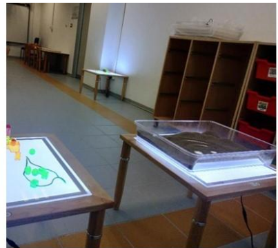
Scuola dell'Infanzia S.M. a Coverciano